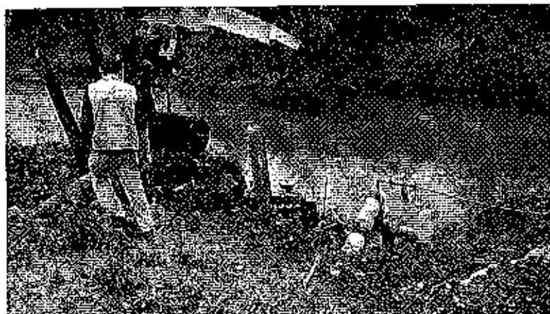
Fotografía 1. Visita técnica y recorrido por la fuente hídrica en el predio de la Sra. Inés Pincay.