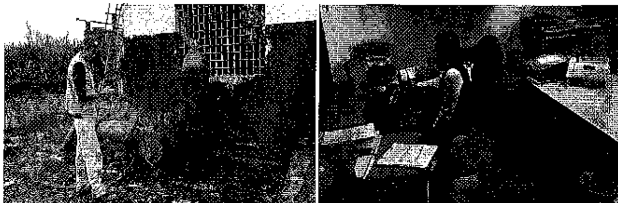
Fotografía 2. Recopilación de información y recorrido por el predio, de propiedad de la Compañía Bamboo Export S.A., y recopilación de información en el CAC Guayaquil.