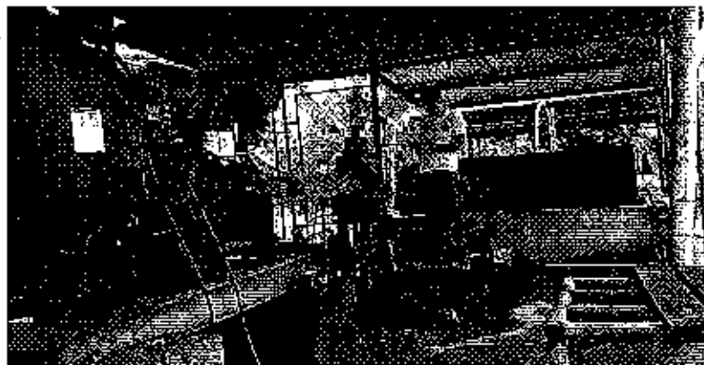
Fotografía 3. Recopilación de información y recorrido por el predio, propiedad de la Compañía Agrícola San Carlos S.A.