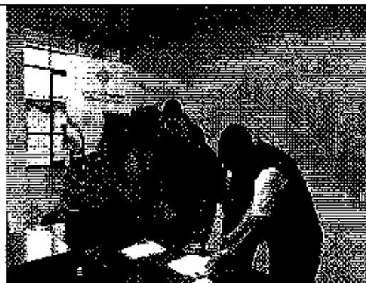
Ilustración 2. Firma de Acta GADM de El Pan