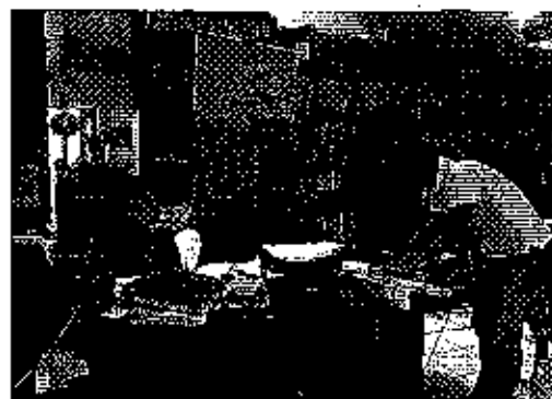
Ilustración 4. Firma de Acta GADM Paute