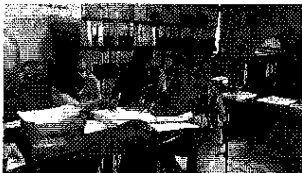
Ilustración 3. Reunión en el GADM Paute