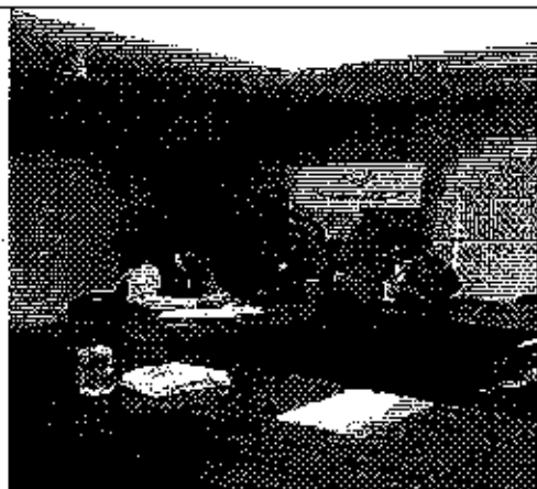
Ilustración 1. Reunión en el GADM de El Pan