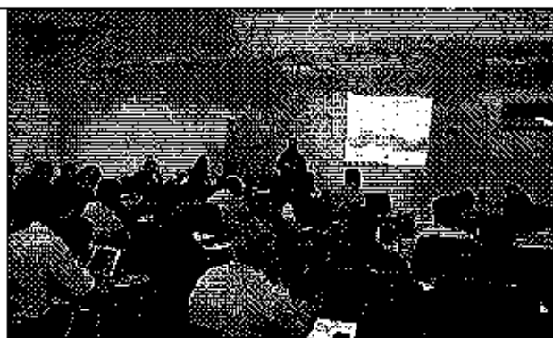
Ilustración 3. Presentación de la institucionalidad de la ARCA y Normativa de evaluación de los servicios públicos de agua potable y saneamiento.