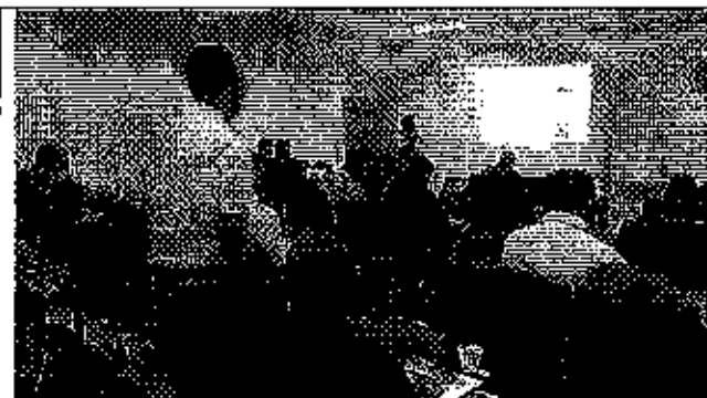
Ilustración 1. Presentación de la metodología de elaboración de la memoria técnica.