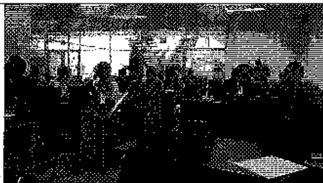
Ilustración 2. Presentación de la herramienta de evaluación.