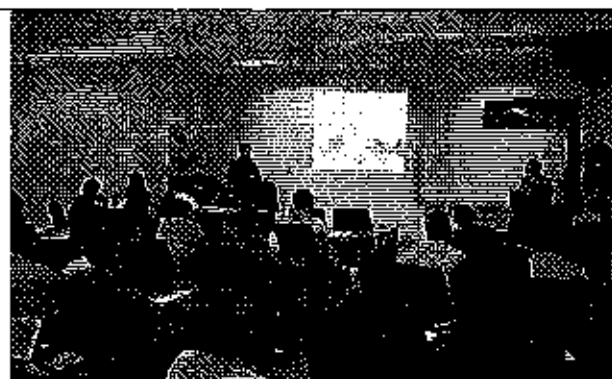
Ilustración 4. Respuestas a las preguntas realizadas por los representantes de los GADMs