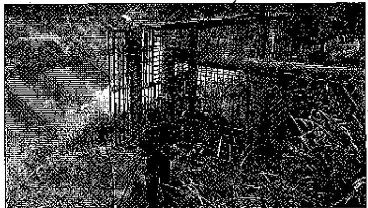
Fotografía 1. Visita técnica y recorrido por las fuentes hídricas en el predio Finca Buena fe.