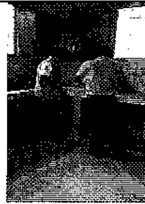
Ilustración 4. Explicación de los procesos para la elaboración del Plan de Mejora del GADM de Naranjal.