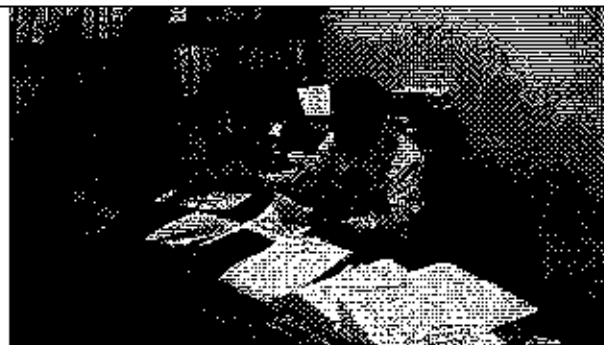
Ilustración 2. Firma del Acta de compromisos por parte del GADM de Atahualpa.