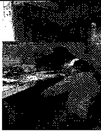
Ilustración 3. Verificación de la información, conjuntamente con los funcionarios del GADM de Naranjal.