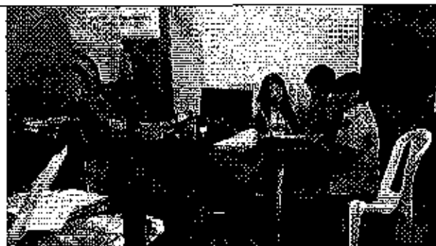
Ilustración 1. Presentación del análisis de la información remitida a la ARCA por parte del GADM de Atahualpa.