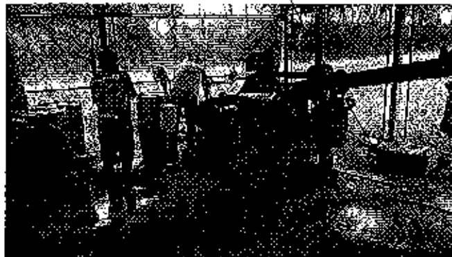
Fotografía 4. Visita técnica y recorrido por las fuentes hídricas en el predio de la compañía Novellmax.