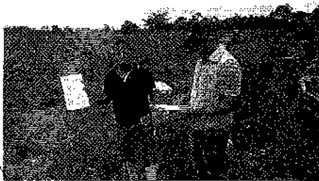
Fotografía 2. Visita técnica y recorrido por las fuentes hídricas en el predio denominado Hacienda La Florida.