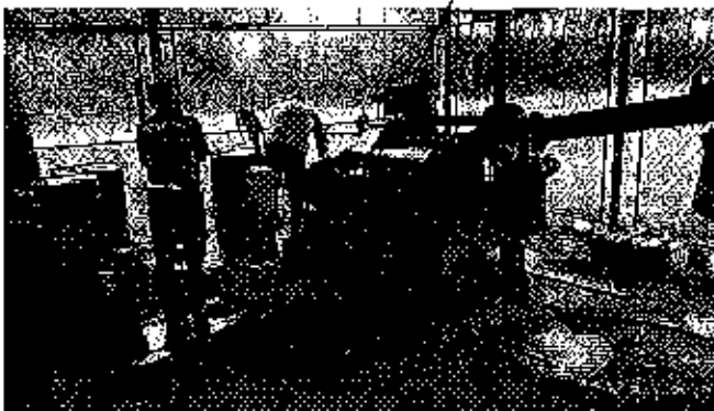
Fotografía 4. Visita técnica y recorrido por las fuentes hídricas en el predio de la compañía Novellmax.