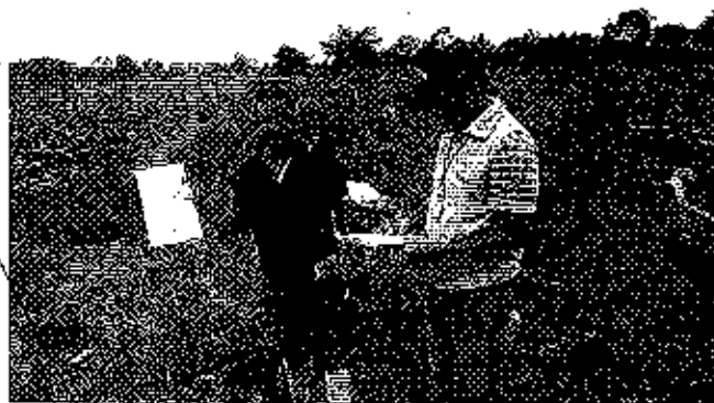
Fotografía 2. Visita técnica y recorrido por las fuentes hídricas en el predio denominado Hacienda La Florida.