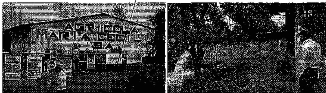
Fotografía 3. Inspección Técnica al predio denominado Hacienda María Cecilia