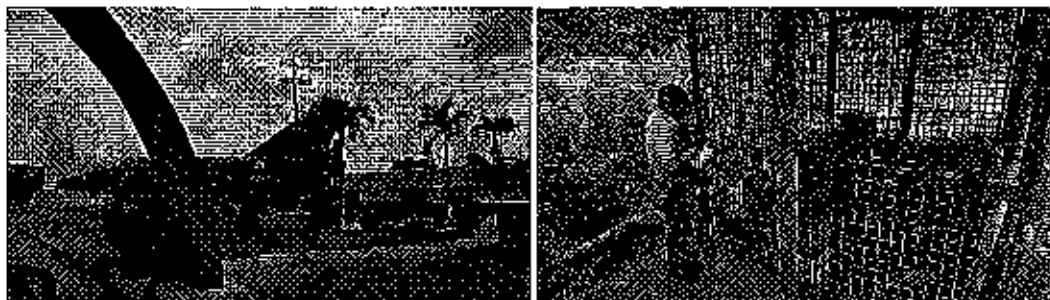
Fotografía 2. Inspección al sitio de captación de agua Base Taura