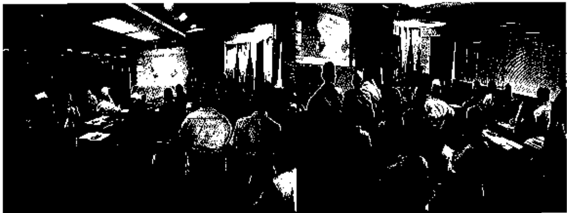
Fotografía 1. Consulta Pública con los representantes del Consejo de Cuenca en la Sala de Sesiones de la Subsecretaría de la DH Guayas – Guayaquil.