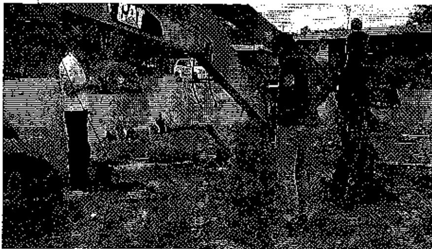
Fotografía 2. Visita técnica y recorrido por las fuentes hídricas en el predio de la Cía. Industrial Bananera Álamos.