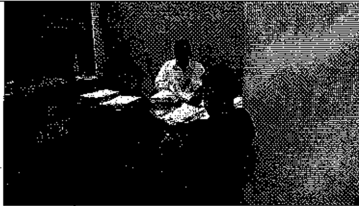
Fotografía 4. Reunión y recopilación de información en el CAC Guayaquil.