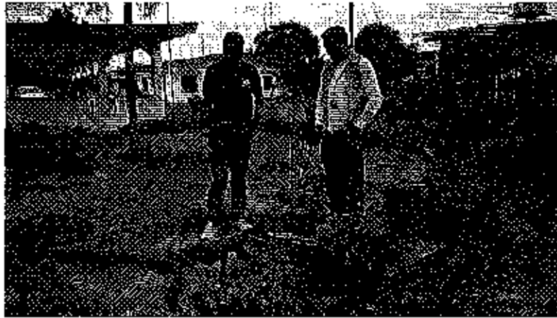
Fotografía 3. Recopilación de información y recorrido en el predio, propiedad de la Compañía Vearan S.A.