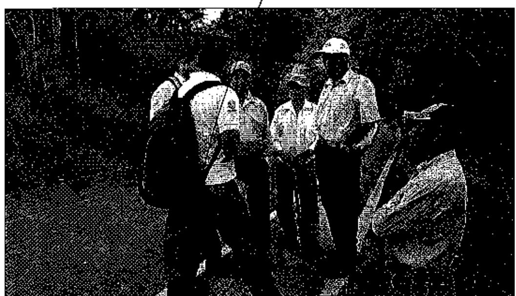
Fotografía 1. Reunión de trabajo y recopilación de información.