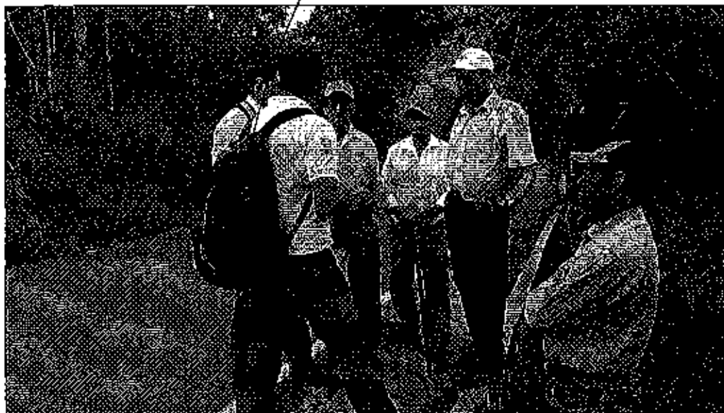
Fotografía 1. Reunión de trabajo y recopilación de información.