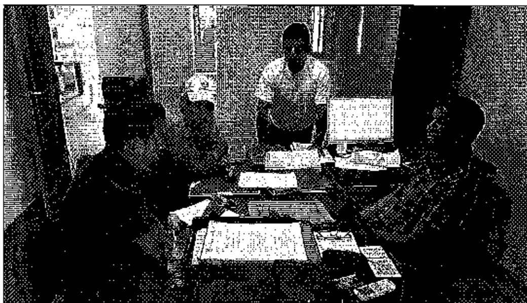
Fotografía 2. Reunión con el responsable técnico del CAC Catamayo