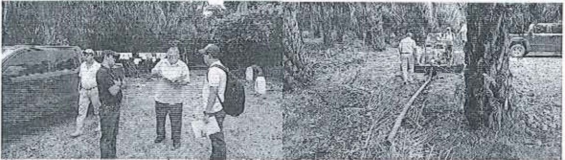
Fotografía 2. Reunión e inspección en la hacienda La Delicia.