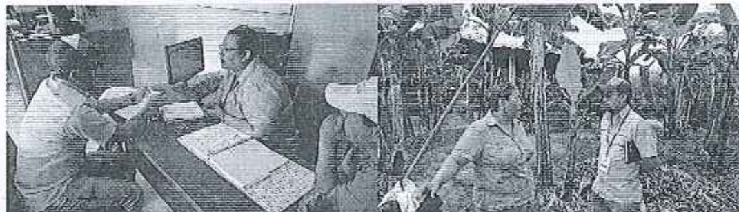
Fotografía 1. Reunión de trabajo y recopilación de información.