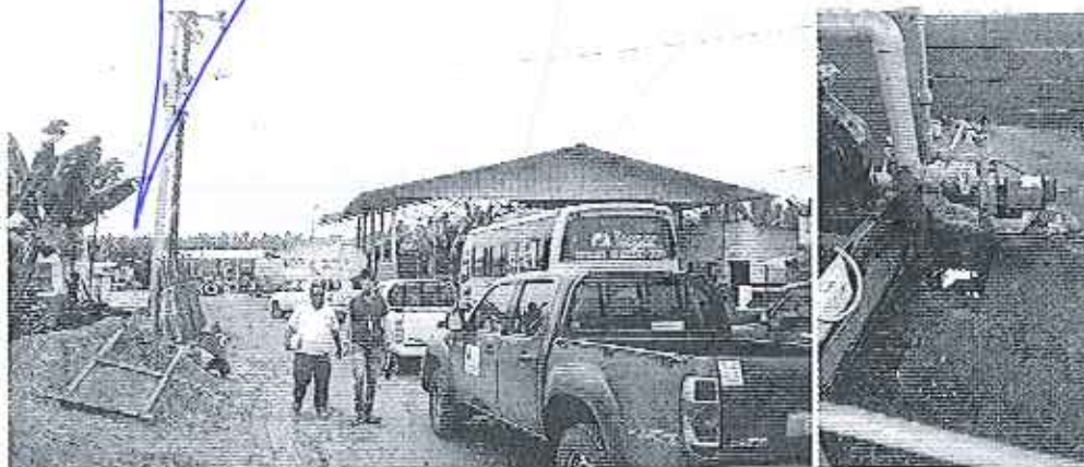
Fotografía 3. Visita técnica al predio de la Compañía Hasanrita S.A.