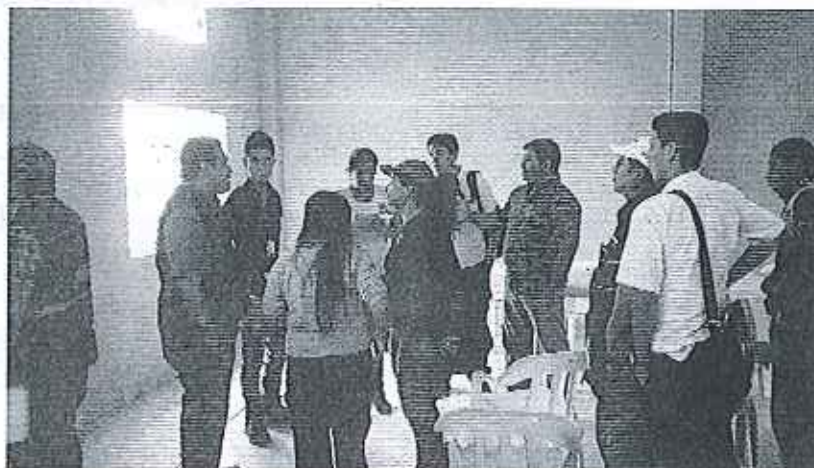
Fotografía 1. Reunión de coordinación con las instituciones públicas asistentes.