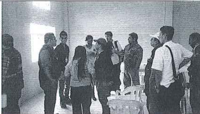
Fotografía 1. Reunión de coordinación con las instituciones públicas asistente.