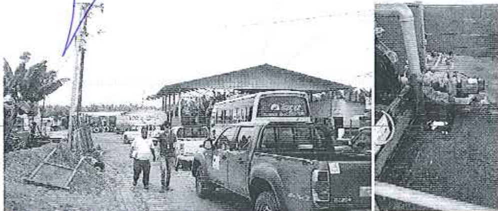
Fotografía 3. Visita técnica al predio de la Compañía Hasanrita S.A.