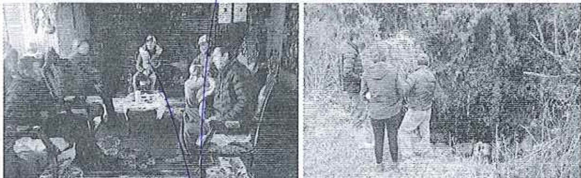
Fotografía 2. Reunión e Inspección técnica para la constatación de los hechos denunciados.