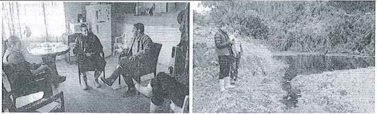
Fotografía 1. Reunión e Inspección técnica para la constatación de los hechos denunciados.