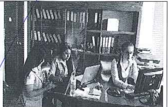
Ilustración 2. Reunión GADM de El Carmen - Área Financiera