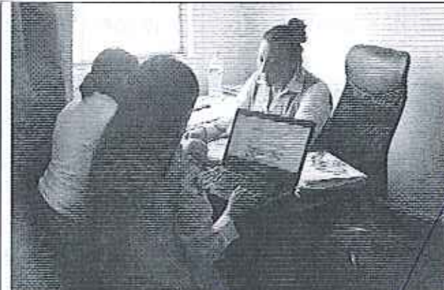
Ilustración 1. Reunión en el GADM de El Carmen - Área Técnica