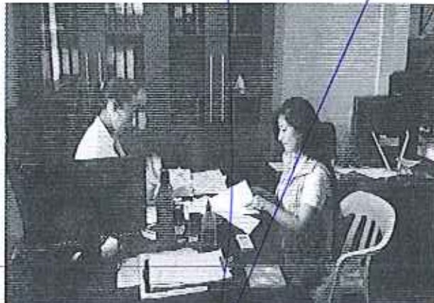
Ilustración 3. Reunión GADM de El Carmen - Área Administrativa