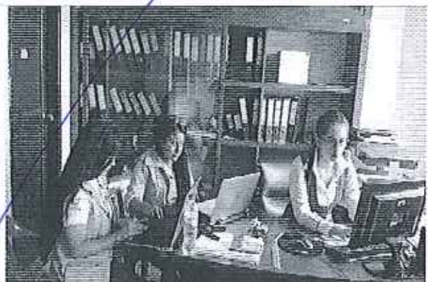
Ilustración 2. Reunión GADM de El Carmen - Área Financiera