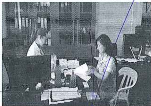
Ilustración 3. Reunión GADM de El Carmen - Área Administrativa