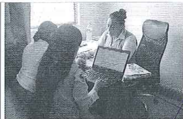
Ilustración 1. Reunión en el GADM de El Carmen - Área Técnica