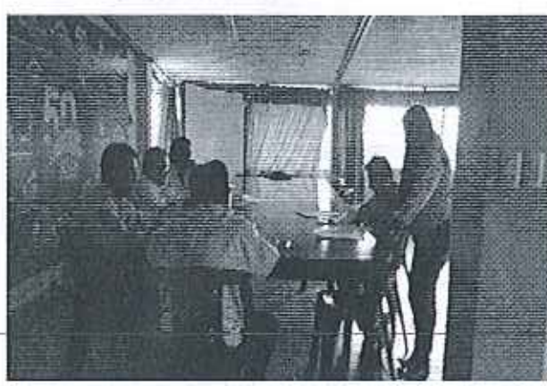
Ilustración 4. Firma de Acta- GADM El Carmen