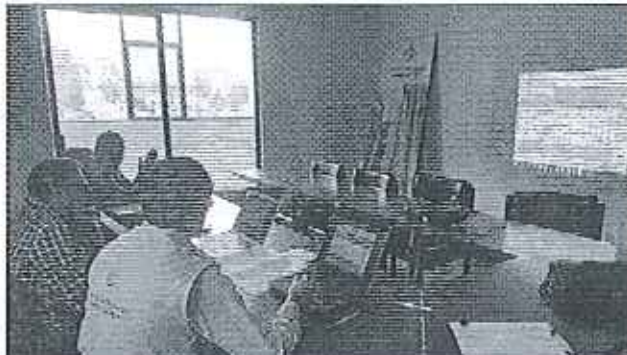
Ilustración 5. Explicación de los procesos para el levantamiento de información de los años 2014 y 2015 GADM de Suscal.