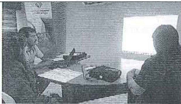
Ilustración 3. Explicación de los procesos para la elaboración del Plan de Mejora del GADM de Simón Bolívar.