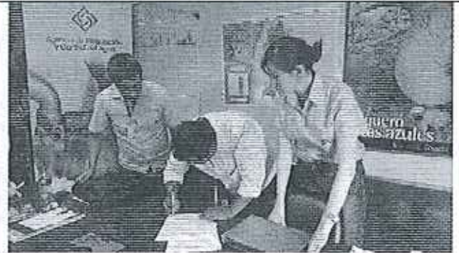
Ilustración 2. Firma del Acta de compromisos por parte del GADM de San Jacinto de Yaguachi.