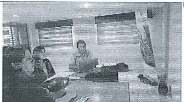
Ilustración 4. Verificación de la información, conjuntamente con el funcionario del GADM de Simón Bolívar.