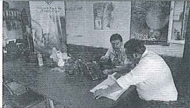
Ilustración 1. Levantamiento de la información proporcionada por el GADM de San Jacinto de Yaguachi.