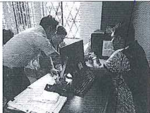
Ilustración 7. Verificación de información en el GADM de Loreto