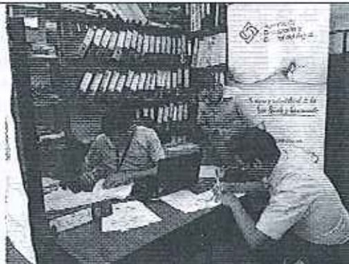
Ilustración 8. Firma de Acta de Compromisos GADM de Loreto