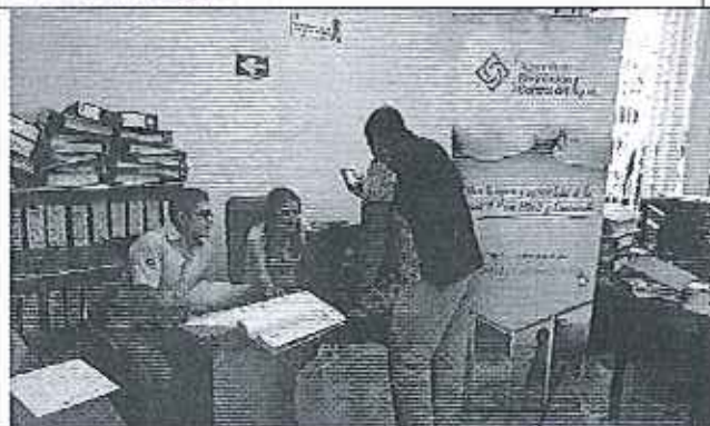
Ilustración 5. Reunión en el GADM de Loreto