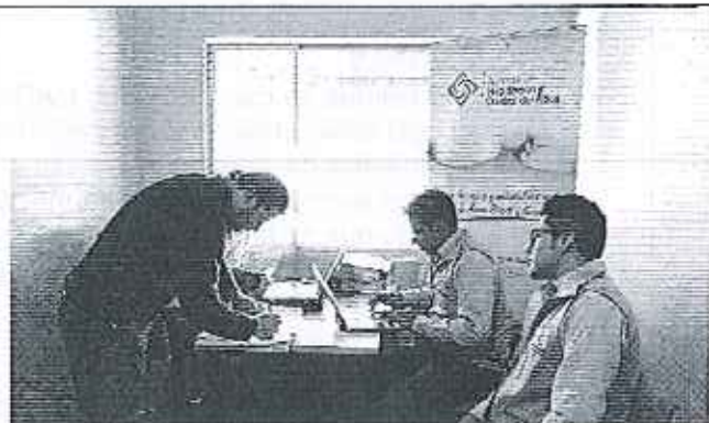
Ilustración 4. Firma de Acta de Compromisos GADM de Quijos