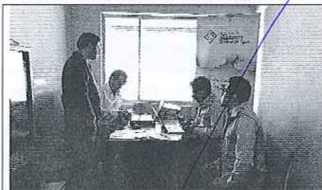
Ilustración 1. Reunión en el GADM de Quijos