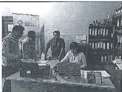
Ilustración 3. Levantamiento de información en el GADM de Quijos