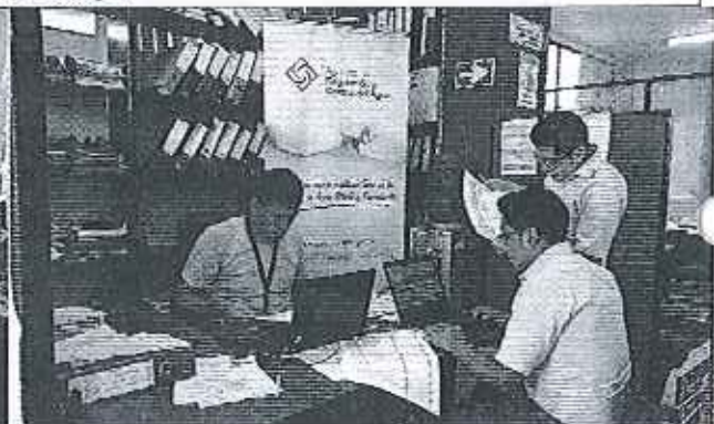
Ilustración 6. Verificación de información en el GADM de Loreto