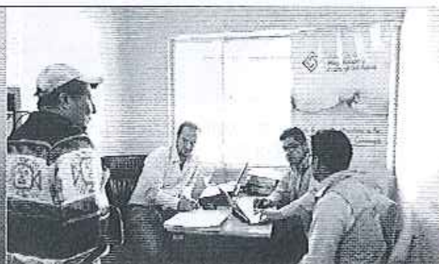
Ilustración 2. Levantamiento de información en el GADM de Quijos