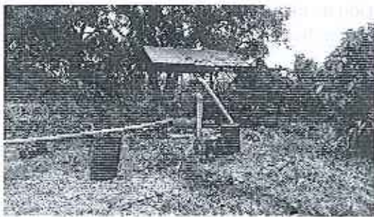
Fotografía 3. Bomba de captación Nro3 – Aguas Subterráneas