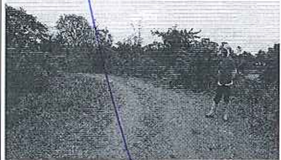
Fotografía 4. Obstrucción Cauce Natural del Estero Moja Huevo