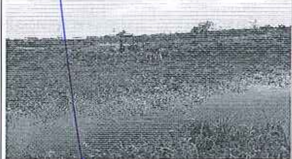
Fotografía 2. Bomba de captación Nro2 – Estero Moja Huevo