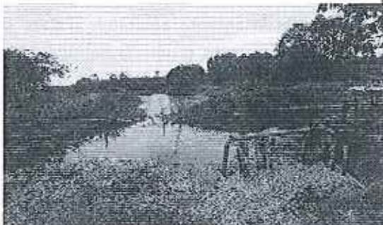
Fotografía 5. Desvió Cauce natural Estero Moja Huevo