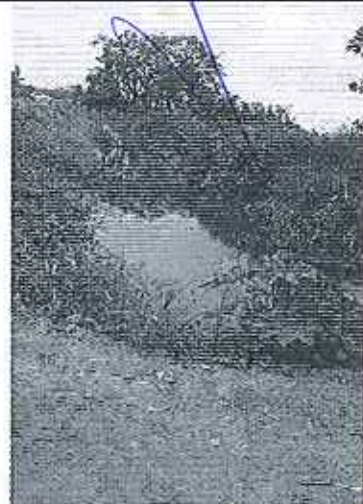
Fotografía 6. Obstrucción Cauce desvió del Estero Moja Huevo