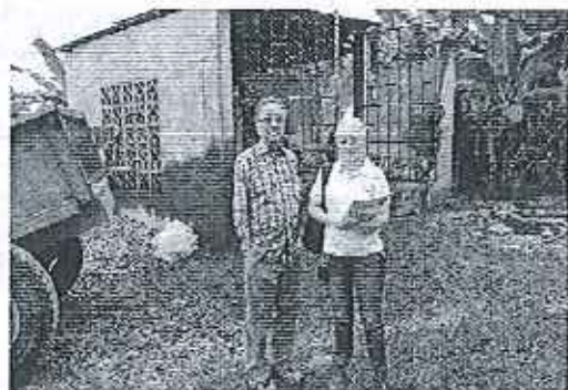
Fotografía 1. Propietario de la Hacienda.