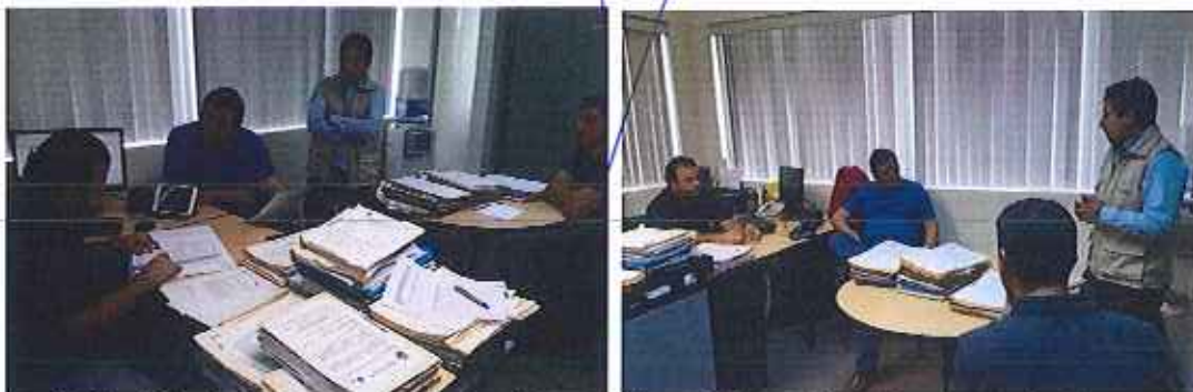
Fotografía 4. Profesionales de la ARCA en reunión de trabajo con el director del área jurídica de la Subsecretaría de la DH Guayas.