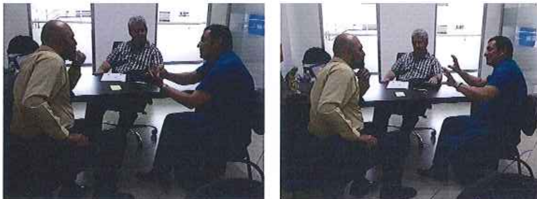
Fotografía 5. Reunión de trabajo con funcionarios de la en la Empresa Pública del Agua EP... Gerencia de Comercialización.