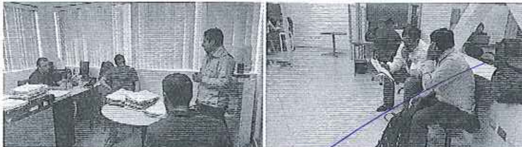
Fotografía 3. Reunión de trabajo en la Subsecretaría del la DH-Guayas y en las oficinas de la EPA-EP

✓ Traslado vía terrestre desde el cantón Samborondón hacia la ciudad de Quito.