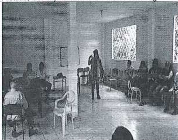
Ilustración 7. Reunión con la JAAP-Guamag-Yacu, se cuenta con la presencia de los funcionarios de la SENAGUA y del GADM de Echeandía.