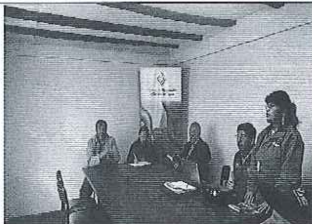
Ilustración 5 Reunión con los funcionarios del Departamento de Agua Potable y Alcantarillado, Alcalde, Concejales del GADM de Chordeleg