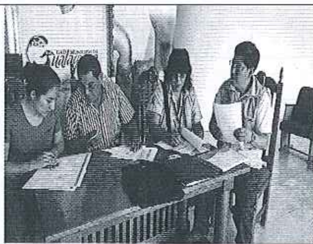
Ilustración 4. Firma de acta con los técnicos del GADM de Gualaquiza