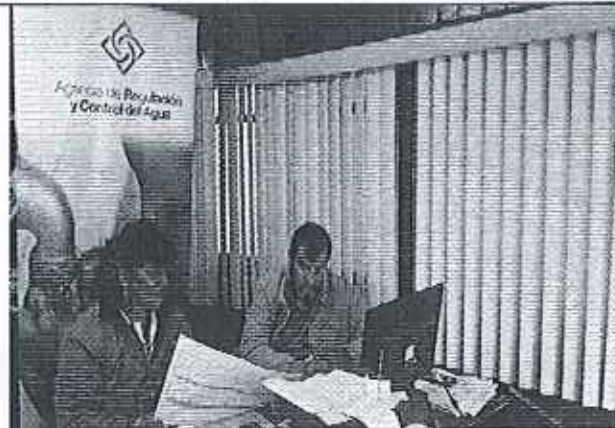
Ilustración 6. Revisión del Anexo 2 en el GADM de Chordeleg