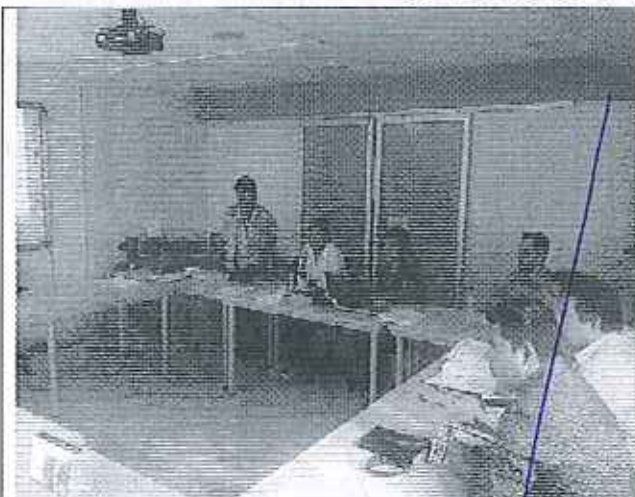
Ilustración 1. Reunión con los funcionarios del Departamento de Agua Potable y Alcantarillado, Alcalde, Concejales del GADM de Gualaquiza