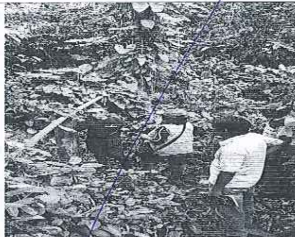
Ilustración 8. Inspección técnica al sistema de agua de la JAAP Guamag-Yacu