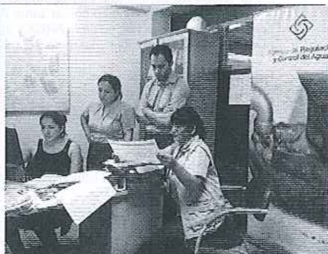
Ilustración 1. Verificación de la información del Anexo 2 en el GADM de Gualaquiza.