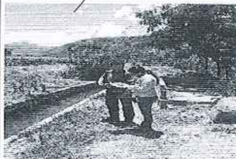
Fotografía 2. Inspección técnica a Compañía Rosa Veintimilla e Hijos.