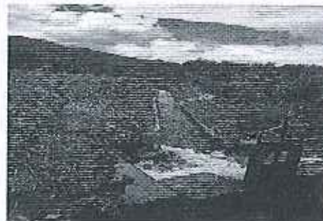
Fotografía 4. Inspección técnica a Compañía VIÑAVALLE.