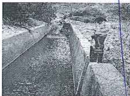
Fotografía 3. Inspección técnica a Monterrey Azucarera Lojana MALCA.