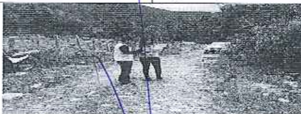
Fotografía 5. Inspección técnica a ENERNATURA INTERAMERICANA, en cantón Palanda provincia Zamora Chinchipe.