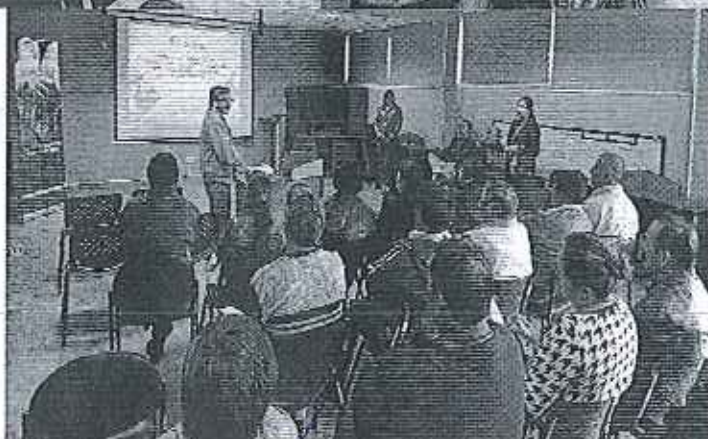
Fotografía 1. Consulta Pública de la Normativa Técnica para la evaluación y diagnóstico de los PSR de la DH. Santiago.