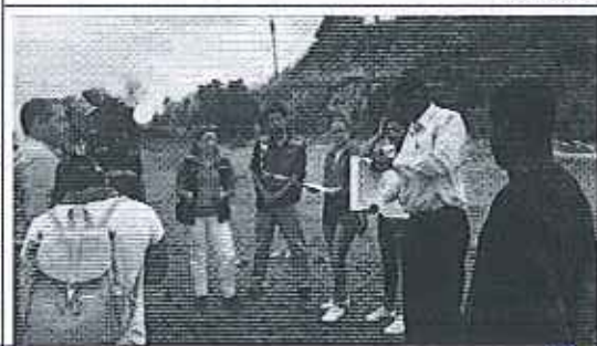
Reunión entre el GADPE, GADME, dirigentes sociales del sector y técnico de la ARCA.