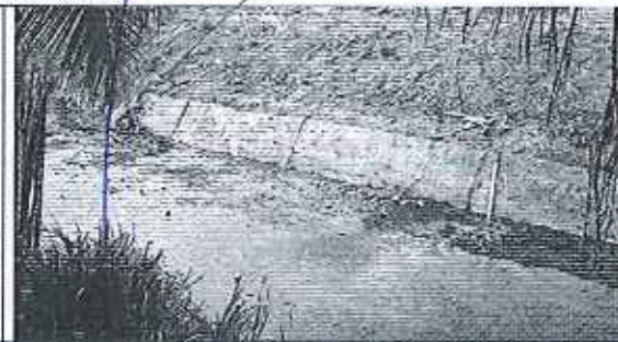
Inspección acuerdos alcantarillado Recinto Las Piedras.