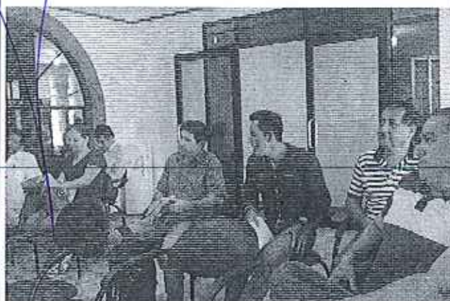
Taller ciudad Tena