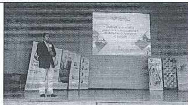
Ilustración 2. Exposición ARCA – GADs Saludables