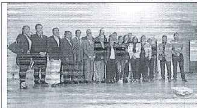
Ilustración 1. Acto de inauguración del taller