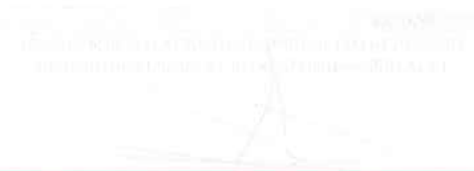
Table 1: Data Summary Table 2: Statistical Analysis