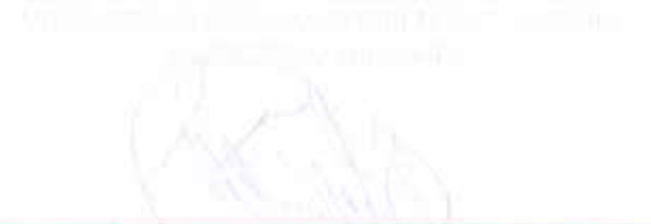
Figure 1: Line graph showing trends over time.