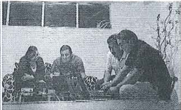
Fotografías 1. Reunión de revisión y ajustes a las presentaciones para el evento de socialización de la metodología de levantamiento de información de PSRC y UI. 07-11-2017.