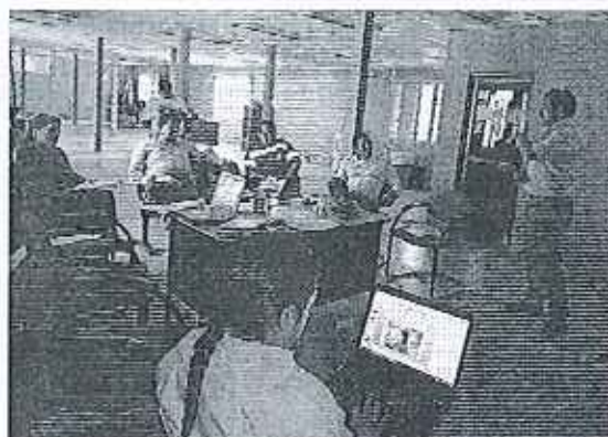
Fotografías 2. Evento de socialización de la metodología de levantamiento de información de PSRC y UI. Campamento EPA-EP 08-11-2017.