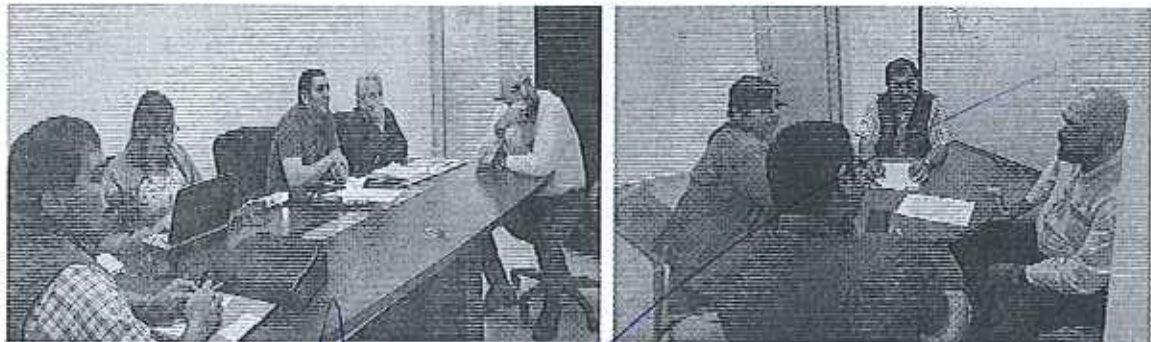
Fotografía 4. Participantes en las reuniones de trabajo con el Gerente Comercial y Funcionarios de la EPA-EP para la entrega de información de los PSRC y UI. 10-11-2017.