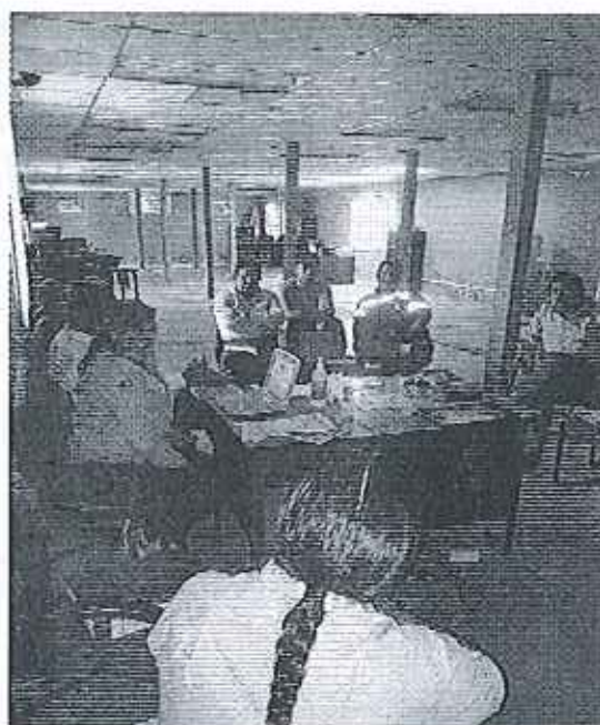
Fotografías 2. Evento de socialización de la metodología de levantamiento de información de PSRC y UI. Campamento EPA-EP 08-11-2017.