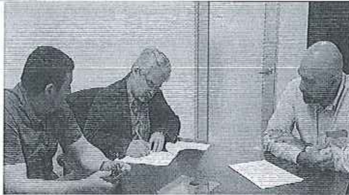
Fotografía 4. Participantes en las reuniones de trabajo con el Gerente Comercial y Funcionarios de la EPA-EP para la entrega de información de los PSRC y UI. 10-11-2017.