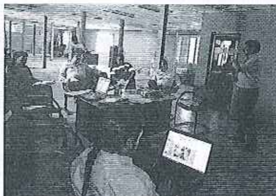
Fotografías 2. Evento de socialización de la metodología de levantamiento de información de PSRC y UI. Campamento EPA-EP 08-11-2017.