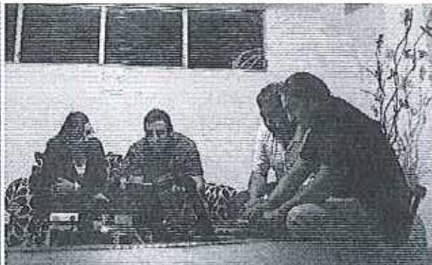
Fotografías 1. Reunión de revisión y ajustes a las presentaciones para el evento de socialización de la metodología de levantamiento de información de PSRC y UI. 07-11-2017.