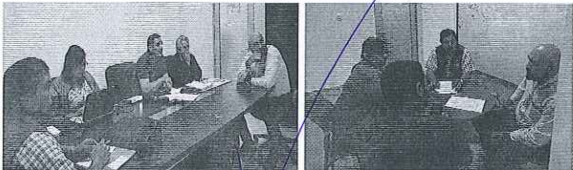
Fotografía 4. Participantes en las reuniones de trabajo con el Gerente Comercial y Funcionarios de la EPA-EP para la entrega de Información de los PSRC y JI. 10-11-2017.