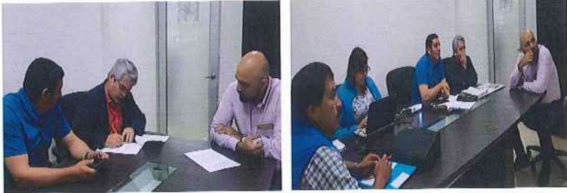
Fotografía 4. Profesionales de la ARCA participando de la reunión de trabajo con el Gerente Comercial y Funcionarios de la EPA-EP en la entrega de información de los PSRC y UI. 10-11-2017.