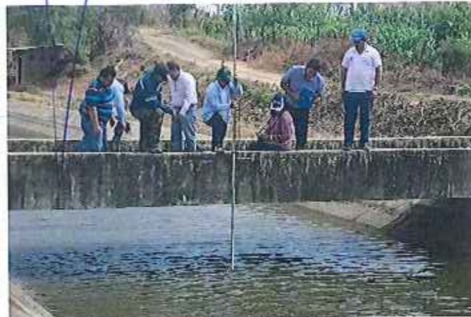
Fotografía 3. Profesionales de la ARCA en reunión con los miembros del Banco PIDASSE y Prácticas de campo sobre medición de caudales - 09-11-2017.