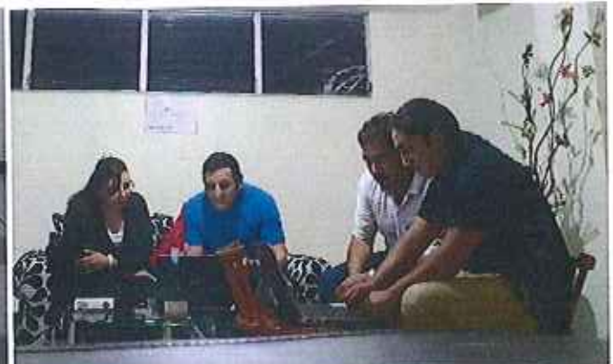
Fotografías 1. Profesionales de la ARCA en reunión de revisión y ajustes a las presentaciones para el evento de socialización de la metodología de levantamiento de información de PSRC y UI. 07-11-2017.