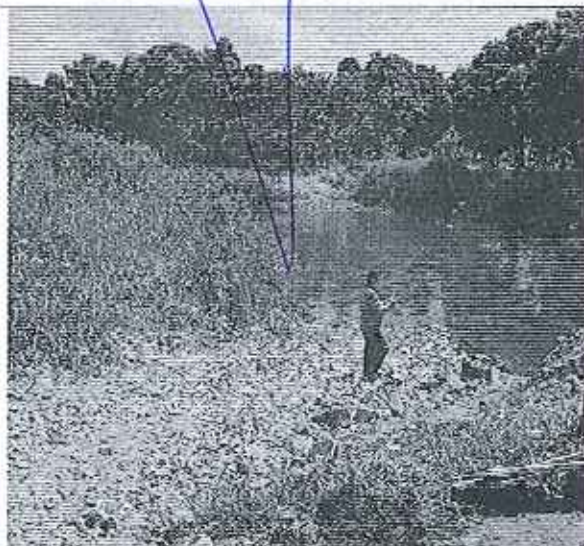
Fotografía 1. Relleno en el Río Pula