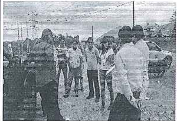
Fotografía 3.- Atención caso Ingenio La Troncal