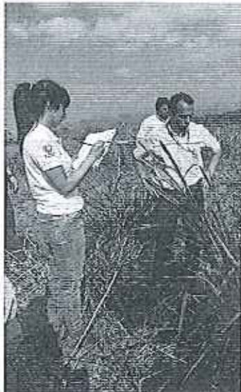
Fotografía 3.- Atención caso Ingenio La Troncal