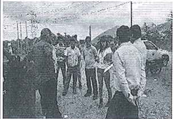
Fotografía 3.-Asistentes en atención del caso La Troncal