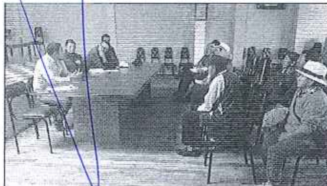
Fotografía 2. Conversatorio con todos los actores involucrados en la problemática presentada en la Comunidad de Pullcanga.