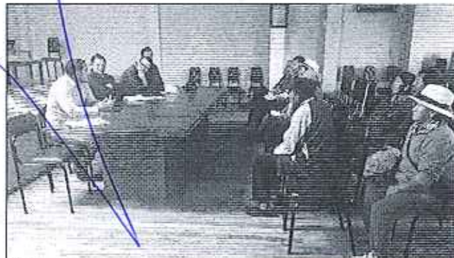
Fotografía 2. Conversatorio con todos los actores involucrados en la problemática presentada en la Comunidad de Pulcanga.