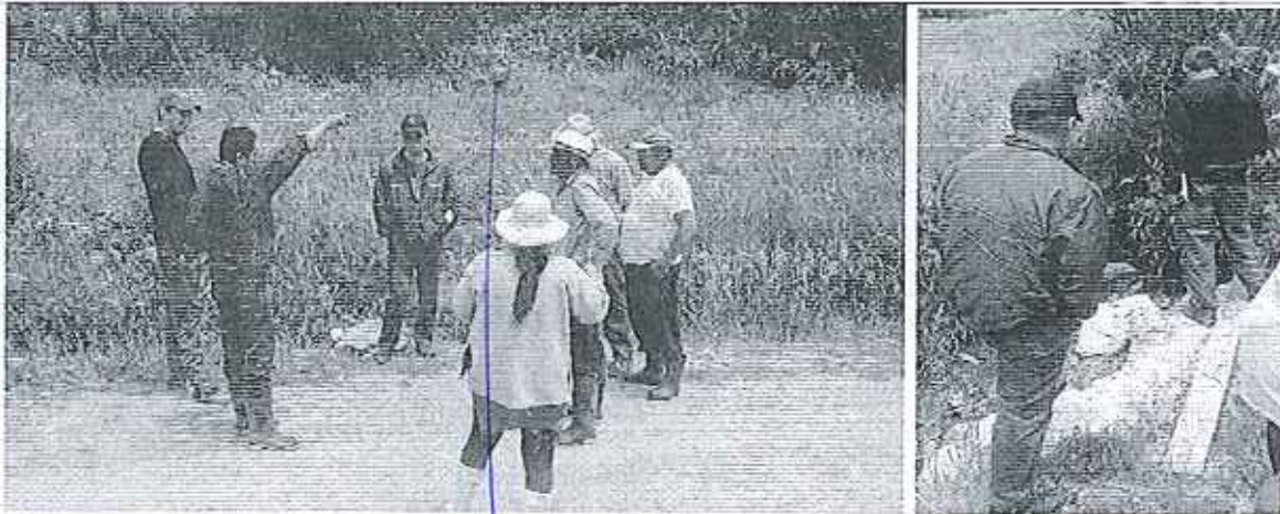
Fotografía 1. Reunión e Inspección técnica para la constatación de los hechos denunciados.