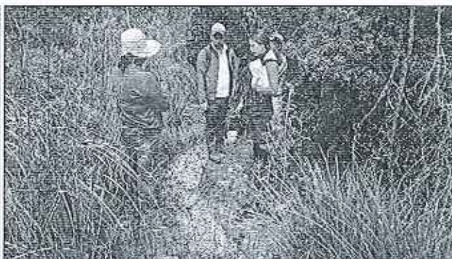
Fotografía 1. Recopilación de información y recorrido por el predio.