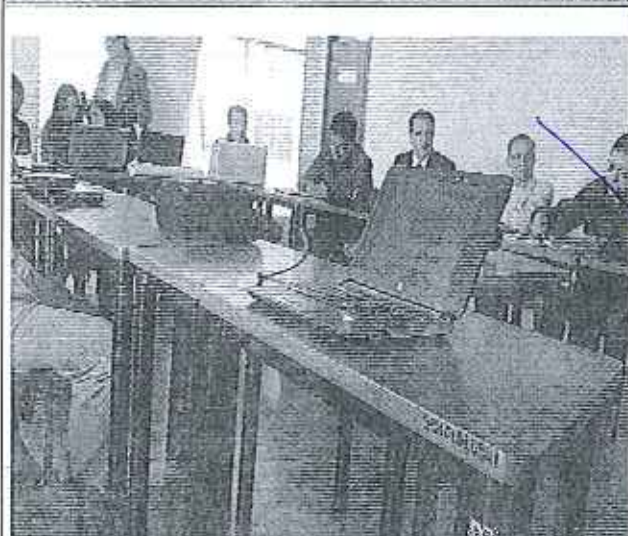
Taller ciudad Tulcán