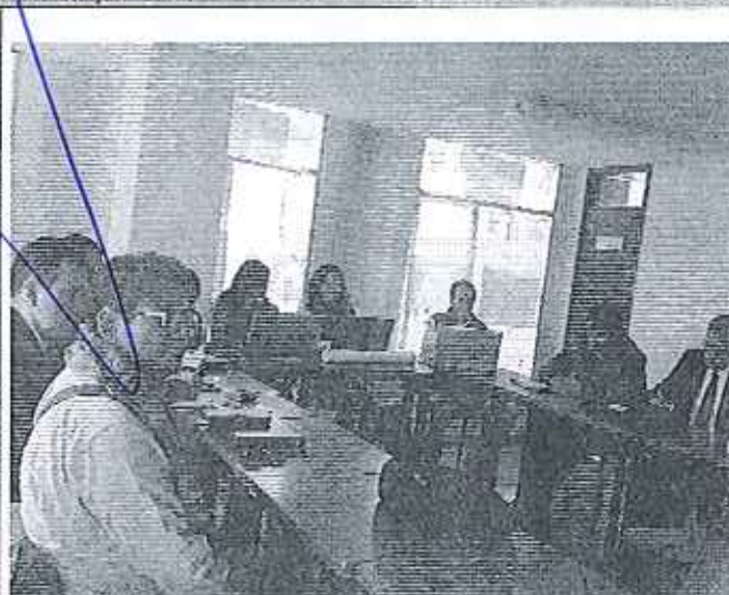
Taller ciudad Tulcán