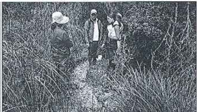
Fotografía 1. Recopilación de información y recorrido por el predio.