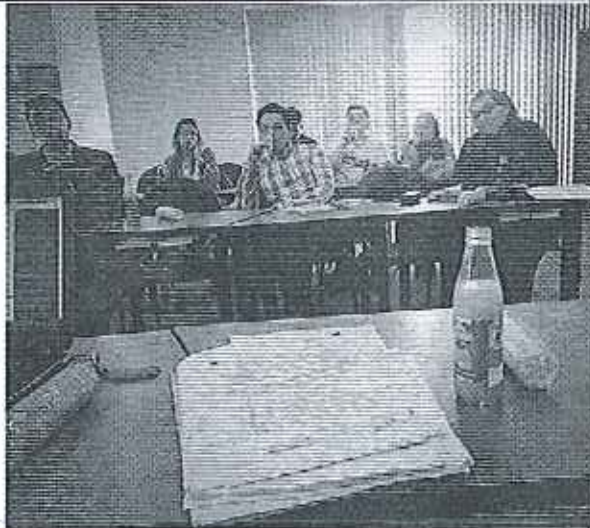
Fotografía 1. Taller Ibarra-Demarcación Hidrográfica de Mira