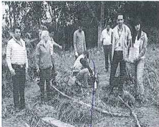
Fotografía 1. Relleno en el Río Pula