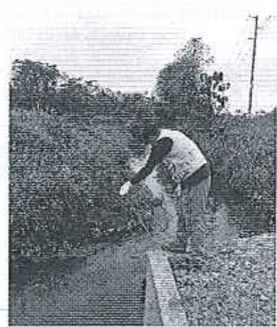
Fotografía 2. Comunidad Comején de Abajo, junto al río Pula