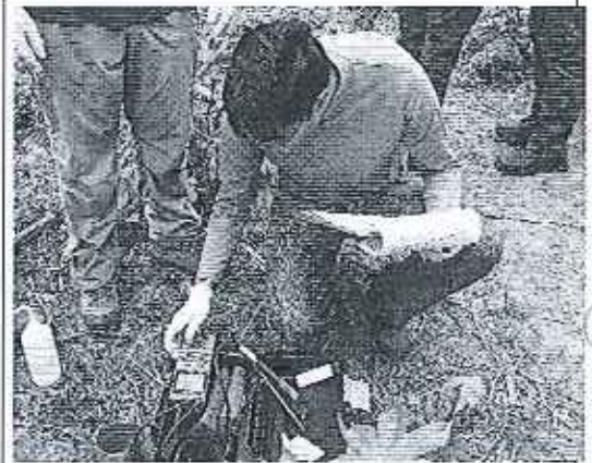
Fotografía 3.- Asistentes en atención del caso La Troncal