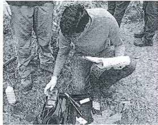
Fotografía 3.-laboratorio LANCAS realizando la lectura de parámetros in situ.