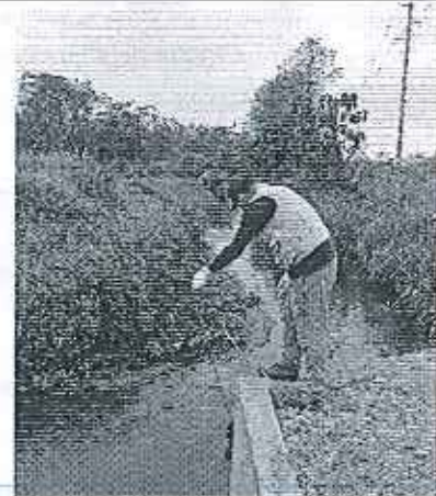
Fotografía 2. Funcionario del INAMHI, realizando la toma de muestra en el P1.