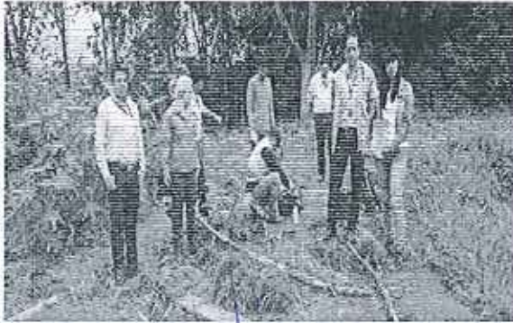
Fotografía 1. Asistentes a la toma de muestras de agua.