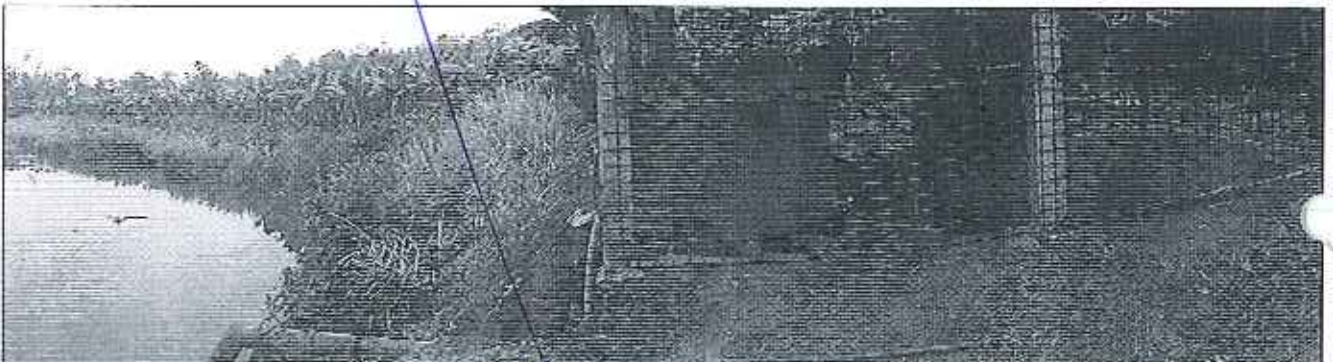
Fotografía 2. Visita técnica y recorrido por las fuentes hídricas en el predio denominado Finca Manguera de la compañía CRAZYDER.