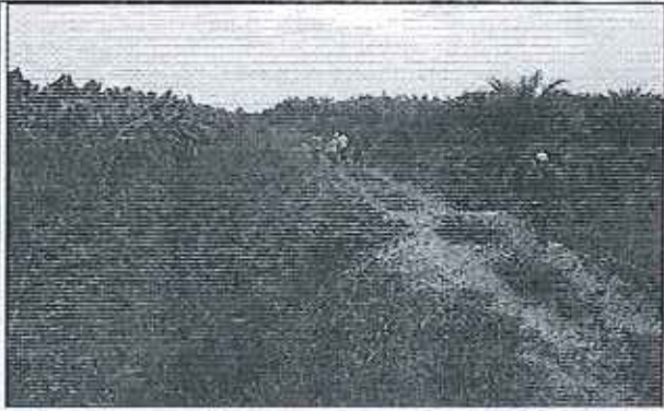
Fotografía 1. Izq. Conversatorio con la Compañía Arqueol S.A. (denunciada). Der. Levantamiento de información por parte del equipo técnico.