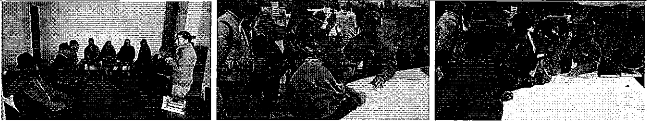
Fotografía 1. Reunión de trabajo en las oficinas del GAD Parroquial de Palmira, Suscripción del acta de compromisos.