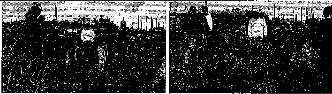
Fotografía 1. Reunión de trabajo e inspección técnica con los miembros de la Junta de Riego Santa Bárbara de Car